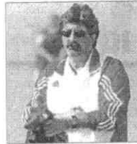
Treinador com problemas

O dirigente recusa especificar os motivos que originaram esta decisão, mas adianta pormenores que lhe desagradaram: "Se me